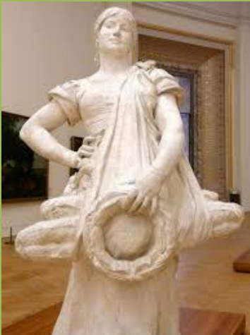
Jules Coutan, La porteuse de pain , 1889