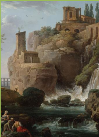
Joseph Vernet, Les cascades de Tivoli (détail), 1740-1748