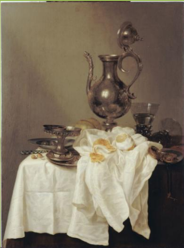
Pieter Claesz, Nature morte à l'aiguière , 1643