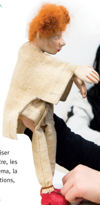
Le collège Flora Tristan en partenariat avec le Théâtre aux Mains Nues en février 2013.

scolaires, chaque projet permet de créer un lien entre les jeunes Parisiens et les lieux culturels. Ces projets ont pour objectif de familiariser les enfants avec les musées, la musique, l'art contemporain, la photo, le théâtre, les arts numériques, le cirque, la poésie, la vidéo, l'image documentaire et le cinéma, la danse, l'architecture... ; en leur proposant, grâce à la fréquentation des institutions, des rencontres avec des œuvres, des artistes et des pratiques artistiques. Les réalisations des enfants sont présentées au public en fin d'année scolaire.