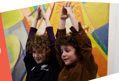
Élèves de l'école du Faubourg Saint-Denis au Musée d'Art moderne de la ville de Paris en février 2013 dans le cadre de École, amie des musées .

31 résidences dans 33 collèges 260 écoles (39% des écoles parisiennes) 70 collèges (63% des collèges parisiens) 200 centres de loisirs (32% des centres de loisirs parisiens)