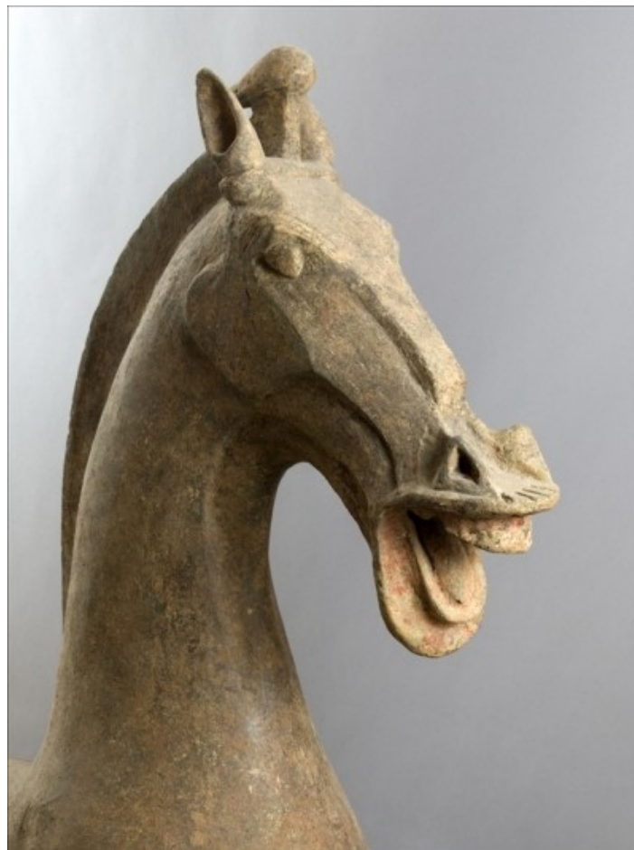
Cheval, époque des han de l'Est (25-220 ap. J.-C.), terre cuite, H : 135 cm ; L : 130 cm ; P : 30 cm, MC 2007-25